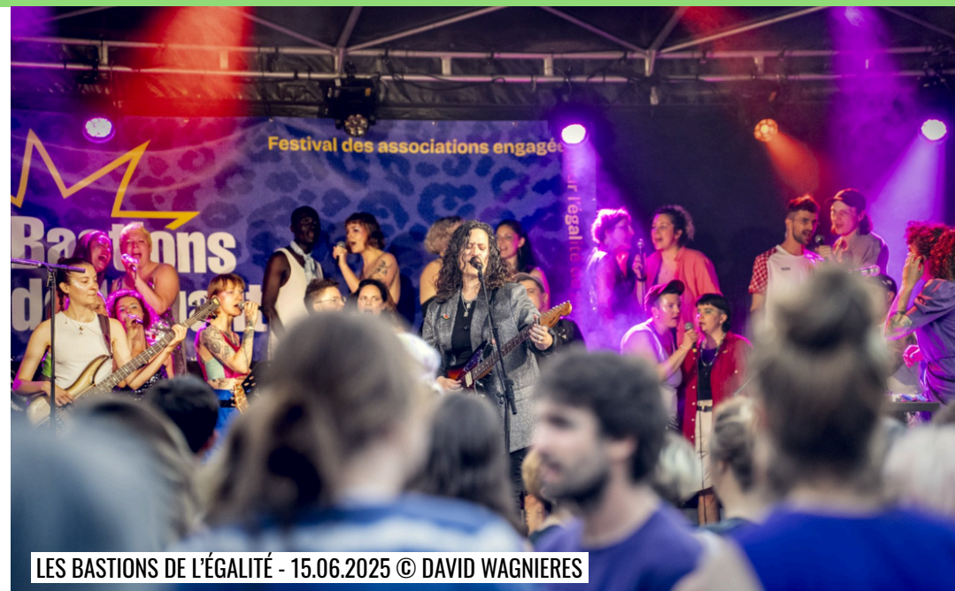
LES BASTIONS DE L'ÉGALITÉ - 15.06.2025

En soirée, le festival a pris une dimension festive et culturelle grâce au partenariat avec le Festival les Créatives, qui a assuré une programmation musicale et artistique mettant à l'honneur des artistes femmes et des personnes issues des minorités de genre. Concerts, performances, chorales et mapping ont rythmé la fin de journée, ancrant l'événement dans une dynamique à la fois engagée et festive.