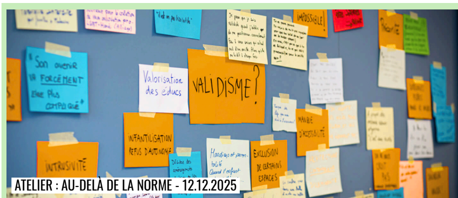
ATELIER : AU-DELÀ DE LA NORME - 12.12.2025