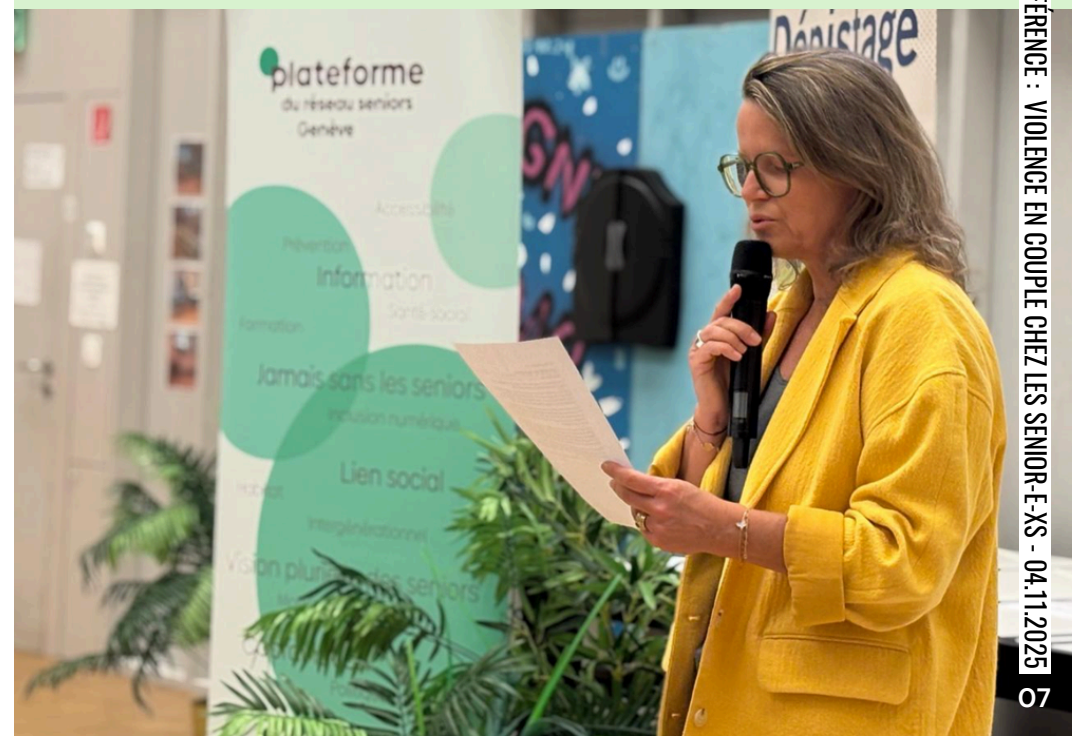
SOIRÉE-CONFÉRENCE : VIOLENCE EN COUPLE CHEZ LES SENIOR·E·XS - 04.11.2025